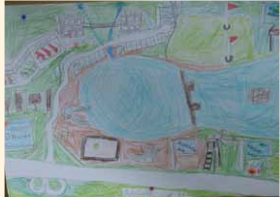
Neugestaltung des Achterdiekseees Zukunftswerkstatt 2002 Viele Ideen der Kinder, z.B. der Bau einer Brücke zwischen Schwimmer- und Nichtschwimmerbereich, konnten umgesetzt werden.