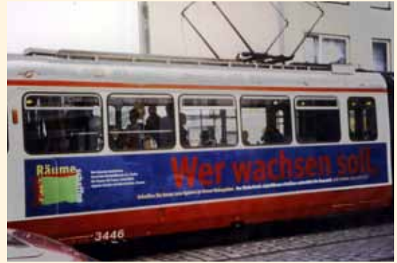
☀️ „SpielRäume schaffen“ Die Gemeinschaftsaktion „SpielRäume schaffen“ wirbt sogar auf der Bremer Straßenbahn