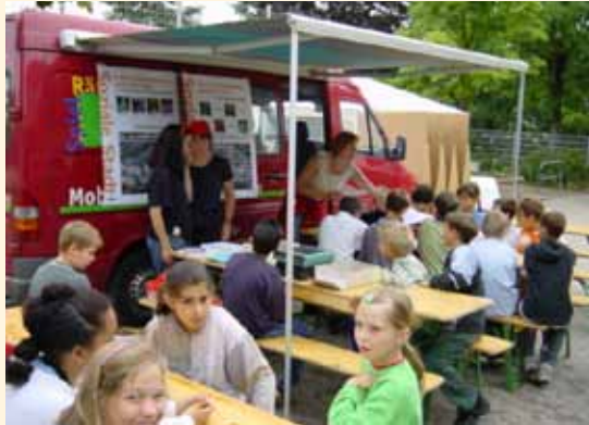
Stadtforscheraktion Darmstadt Einwöchige Stadtforscheraktion 2001 Es wurden zahlreiche Ideen für den Umbau des Soziale Stadt-Gebiets Eberstadt-Süd gesammelt.