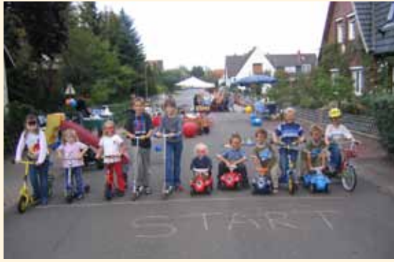
☀️ Straßenspielaktion Seit 1998 gibt es die jährliche Straßenspielaktion an der sich ca. 40 Straßeninitiativen beteiligen.