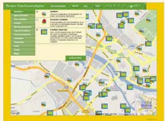
☀️ Familienstadtplan Aus dem Spielflächeninformationssystem entsteht 2006 der Bremer Familienstadtplan.