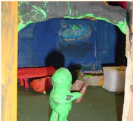
Umzug der Stadtbibliothek Zukunftswerkstatt 2004 Kinder entwickeln Ideen für die neue Kinderbibliothek. Daraus entstanden sind u.a das Piratenschiff, Schaukelsessel und ein Lese-Iglu.