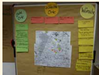
Ein fertiger Exkursionsbericht

Im Frühjahr 2009 startete das Amt für Soziale Dienste Bremen die Spielleitplanung für die Hansestadt Bremen. Geplant auch für andere Stadtteile Bremens, wurde zunächst in Schwachhausen mit einem Pilotprojekt begonnen. Dem vorausgegangen war ein Beschluss des Stadtteilbeirates Schwachhausen zur Durchführung der Spielleitplanung. Der Beirat Schwachhausen arbeitet bereits seit mehreren Jahren sehr engagiert am Thema „Kinder und Jugendliche im Stadtteil“.