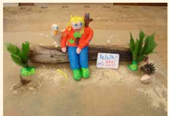
Skulptur der Kinderrechte Zukunftswerkstatt 2009 SchülerInnen des Kippenberg-Gymnasiums entwickeln Skulpturen der Kinderrechte. Zwei Skulpturen entstehen gerade: auf dem Benqueplatz und dem Spielplatz Kirchbachstraße.