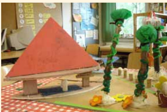
Sicherer Schulweg Grundschule Parsevalstraße Zukunftswerkstatt 2009 Erste Ideen sind bereits umgesetzt, ein Spiel- und Spaßweg ist im Entstehen.