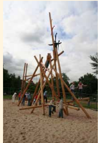
‚Stangengestrüpp‘ an der Wilhelm Kaisen Schule, Bremen-Neustadt

Ein vergleichbares Klettergerät gibt es seit vielen Jahren an der Fridtjof-Nansen-Schule in Hannover-Vahrenheide. Die Schule ist bewegte, gesundheitsfördernde Schule. Beim sogenannten ‚Stangengestrüpp‘, einer mikadoähnlich angeordneten Spielskulptur der Firma J. Richter, handelt es sich um ein Gerät zum echten Klettern, in dem Kinder ständig in grenzwertige Situationen gelangen und in der Auseinandersetzung damit ihre Selbstsicherungsfähigkeit ausbilden können.