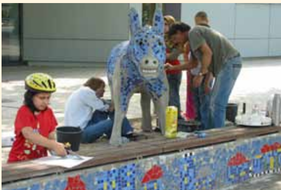
☀️ „SpielRäume schaffen“ „SpielRäume schaffen“ wird 10 Jahre alt. Zum Jubiläum 2007 entstehen in vier Bremer Stadtteilen je eine bespielbare Skulptur.