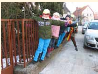
Die Stadtteilforscher und -forscherinnen unterwegs: Mäuerchen und Geländer sind beliebte Klettergelegenheiten