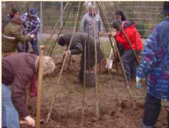
☀️ Weiterbildung Seit 1998 gibt es den Weiterbildungskalender, hier können z.B. PädagogInnen lernen, ein Weidentipi zu bauen.