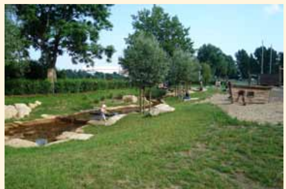
☀️ Pusdorf am Fluss Im Rahmen eines von der EU geförderten Projekts wird 2007 im Bremer Stadtteil Woltmershausen unter umfangreicher Einbeziehung der Bevölkerung ein attraktiver Spiel- und Naherholungsbereich geschaffen.