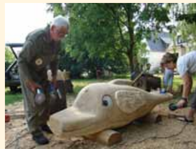
In der Bennigsenstraße wird auf der Wiese musiziert..... und in der Weyerbergstraße ein Holztier hergestellt