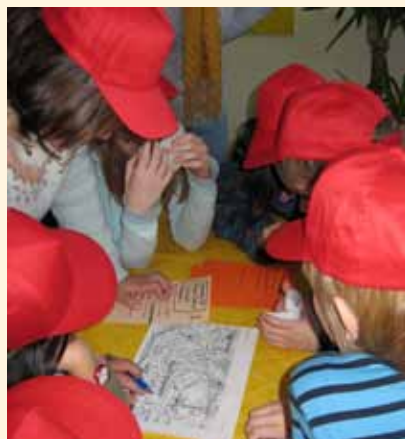
Am Stadtteilplan werden die Exkursionsroute eingetragen und gute und schlechte Orte benannt