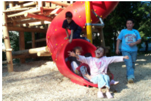
Die Kinder freuen sich über ihren neuen Spielplatz

Demnächst wird ein von den Kindern selbst entworfenes Schild die neuen Regeln für den Spielplatz erklären und für mehr faires Miteinander werben.