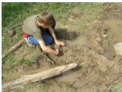
Bauen mit Matsch und Wasser an der Matschkuhle – ein stundenlanges Spiel

werden Kräfte gemessen, auch mal gekämpft. Durchschnittlich spielen ca. 20 Kinder gleichzeitig im ‚Paradies‘, in Ferienzeiten sind es bis zu 60 Kinder. Eine Einmischung von Erwachsenen ist nicht gewollt. Kinder sollen hier sich selbst und andere Kinder erleben können, ohne dabei beobachtet oder angeleitet zu werden. Heutige Kinder sind es nicht mehr gewohnt, sich selbst mit Altersgenossen zu arrangieren.