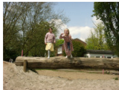
Naturbrücke zum Springen und Balancieren

Dabei geht das Gartenamt nach folgendem Modell vor: Das Gartenamt vergibt den Auftrag an eine/n freie/n ArchitektIn mit der Auflage einen Sozialpädagogen, eine Sozialpädagogin mit einzubeziehen. ArchitektIn und PädagogIn starten die Ideenfindungsphase, nehmen Kontakt zu AnwohnerInnen auf, organisieren eine Kick-off-Veranstaltung, helfen bei der Bildung von Arbeitsgruppen. Nach dem Vorentwurf und der Kostenschätzung werden Bau- und Aktionstage geplant. Es gibt Workshops, Aktionen mit freiwilligen HelferInnen oder sogar große Mitmachbaustellen für die Kinder und immer ein großes HelferInnen- und Eröffnungsfest. Die Oberbauleitung liegt beim Gartenamt, es ist in sämtliche Arbeitsschritte eingebunden.