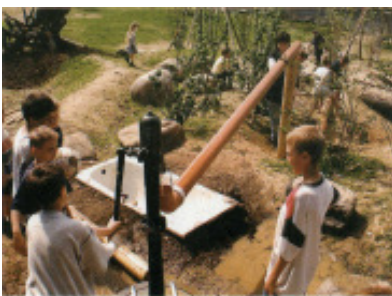
Die obligatorische Wasserstelle

➤ Die Bereitschaft der Begleitpersonen, mit Kindern zu spielen, ist höher als auf herkömmlichen Gerätespielplätzen.