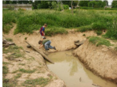
Ein tiefes Grabensystem durchzieht die Kinderwildnis

In Zukunft sollen auch vergängliche Bauwerke wie Lehmhäuser,