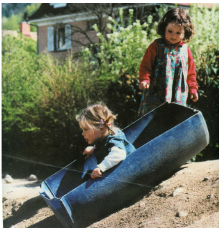
Die blauen halbierten Wassertonnen sind sehr beliebt bei den Kindern, das Gartenbauamt liefert sie, sowie auch anderes bewegliches Spielmaterial, regelmäßig nach

Die als Probelauf deklarierte neuartige Gestaltung der ersten fünf Spielplätze im Jahre 1995 wurde von allen Seiten sehr positiv bewertet. Sicher musste mancher Erwachsene umdenken und es erforderte von allen Seiten eine Änderung der gewohnten ästhetischen Vorstellungen. Es verging mindestens ein Jahr, bis sich ein einigermaßen ‚grüner‘ Eindruck