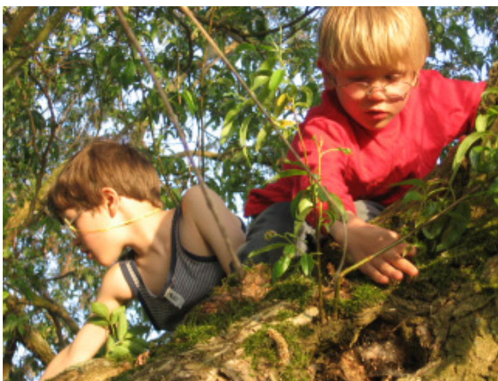
Eine alte Weide - ein vielseitiger, attraktiver Spielraum

In den 70er Jahren im Rahmen der Umweltbewegung stand die damalige