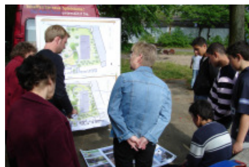
Der Planer stellt den NutzerInnen den Entwurf vor

ern. Im September 2005 hatten Kinder und Erwachsene des Stadtteils ihre Vorstellungen und Wünsche in einer Zukunftswerkstatt formuliert, ein erster Plan war im Oktober 2005 diskutiert worden. Die aktuelle Planung wurde beim Planungszirkel am 17. Mai mit AnwohnerInnen, Kindern und Jugendlichen abgestimmt. Kennzeichnend für das Projekt ist die Idee der Achterbahn, die in der Zukunftswerkstatt entstand. Ein Asphaltkreis zieht sich über kleine Hügel, durch Täler und durch den Spielbereich. Diese Bahn ist befahrbar mit allem was die Kinder mitbringen: Roller, Trampeltrecker, Fahrräder und Inlineskates.