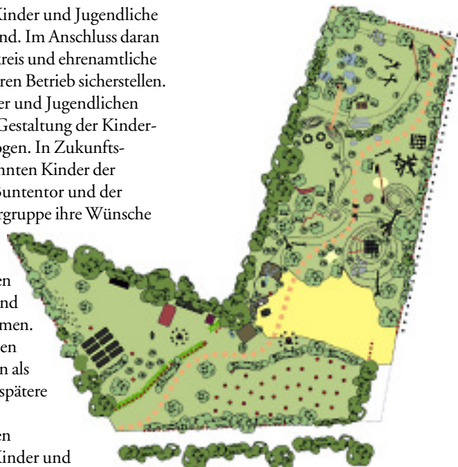
Übersichtsplan der Kinderwildnis

Die erste Resonanz auf die Bremer Kinderwildnis ist auch von Seiten der Erwachsenen durchweg positiv ausgefallen. Sie sind begeistert von der angenehmen Atmosphäre, der natürlichen Gestaltung und dem neuen Spielerleben.