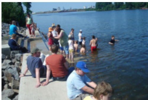
Die neue Treppe in Pusdorf

Nun arbeiten die InitiatorInnen an der Planung des „großen Festes“ im September. Einige Highlights stehen schon fest: Filmbeiträge und Interviews zum Thema „Quartiersentwicklung“, Ausstellung „Am Fluss – By the River“, Präsentation der Wettbewerbsergebnisse „Kunst am Fluss“ und natürlich jede Menge Mitmachaktionen.