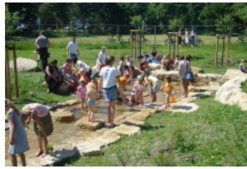
Der neue Wasserlauf wird bespielt