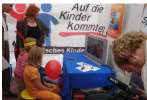
„Kinder in der Kiste“ im Mobil für Kinderfreundlichkeit

Bremer Aktionsbündnis für Kinderrechte organisierte ein kleines Kinderfest und bei schönem Wetter wurde fleißig gespielt, wurden Buttons gedruckt, Luftballonkarten beschriftet und in die Luft geschickt, Fadenspielpfahrungen abgelegt und Korken ins Ziel geschossen. Beim Mobil für Kinderfreundlichkeit konnten die Kinder als „Kinder in der Kiste“ vor der Kamera, im Internet, als Erfinder von Werbesprüchen für mehr Kinderfreundlichkeit oder mit Briefen an die Bundesregierung ihre Probleme, Forderungen, Wünsche und Vorstellungen formulieren. Eindrücke und Ergebnisse der Weltkindertagsaktion sind zu finden im Internet unter www.kinderfreundlichkeit.de und www.weltkindertag.de .