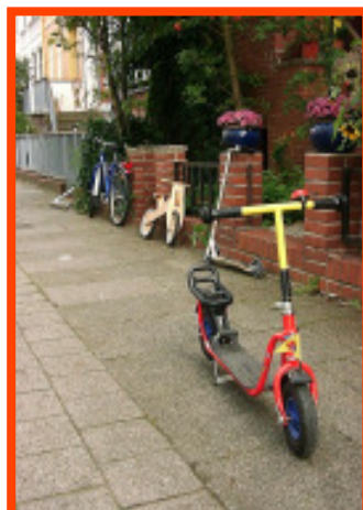
Einmal im Jahr wenigstens ist in Bremen das Spielen auf manchen Fahrbahnen erlaubt

den vielen Kampfhunden, deren Besitzer sich gerne auf dem Platz treffen. Eine komplette, hundesichere Umzäunung war den Kinder ein wichtiges Anliegen.