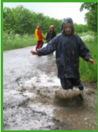
Schlechtes Wetter gibt es nicht!