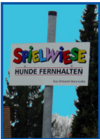
So fing damals alles an: In der Weyerbergstraße gab es eine Wiese, die lediglich von Hunden genutzt wurde - mittlerweile ist es ein lebendiger Treffpunkt geworden.