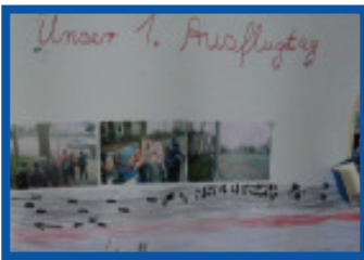
Kinder machen sich in ihrem Stadtteil auf den Weg