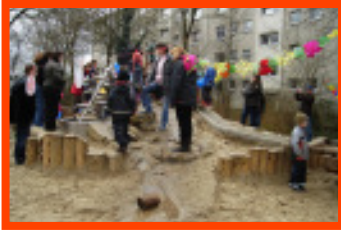
'Wasser marsch' im KTH Heinrich-Imbusch-Weg

Auch das Projekt in der Weyerbergstraße gehört zu den eher älteren Projekten. Hier gab es damals riesige Probleme mit den Anwohnern, die ein Spielraumprojekt mit allen Mitteln verhindern wollten. Zu groß waren die Ängste vor lärmenden Kindern. Dank Unterstützung durch das Ortsamt und zahlreicher Konfliktgespräche konnte