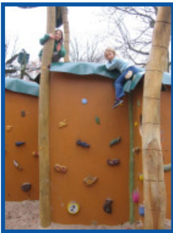
Kinder klettern genau so hoch, wie sie es sich zutrauen

TeilnehmerInnen aus Einrichtungen, die bei der Unfallkasse Bremen versichert sind, wird der Beitrag erstattet.