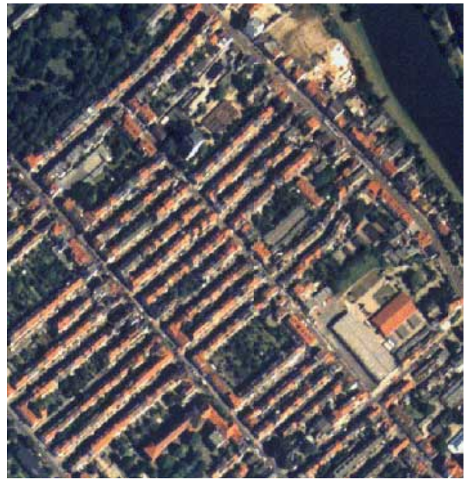
Abb. 3 + 4: Stadtplan und Luftbild des Quartiers, Quelle: GeoInformation Bremen 2000.