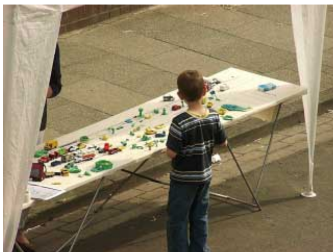
Abb. : An einem einfachen Straßenmodell konnten Jung und Alt Umgestaltungsvorschläge machen