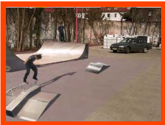
Abb. 1: Ideen für eine Skateranlage auf dem Extra-Markt-Gelände