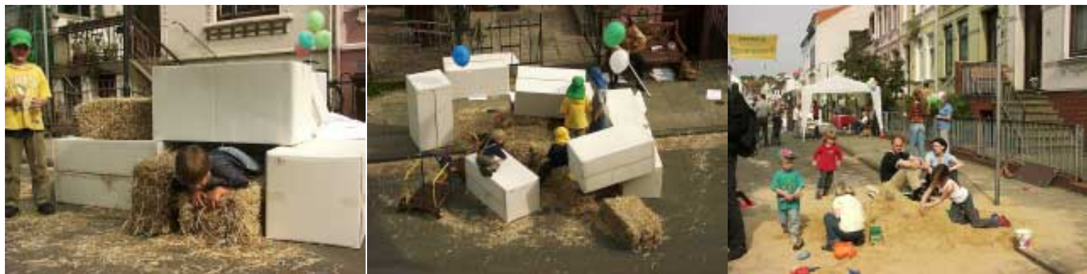
Abb.: Die Kinder nutzen vorhandene einfache Gestaltungsmöglichkeiten für ihr Spiel

Am Tag selbst und in den Wochen danach wurde deutlich, dass teilweise von Vertreter/innen aus Politik und Verwaltung weiterhin Bedenken bestehen. Diese beziehen sich in erster Linie auf die Durchsetzbarkeit innerhalb der Straßengemeinschaft, da es sich um ein sozial- und altersgemischtes Quartier handelt.