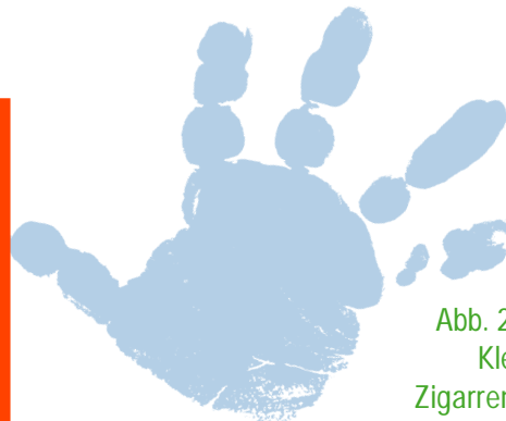
Abb. 2: Projektidee Kletterwand am Zigarrenmacherplatz