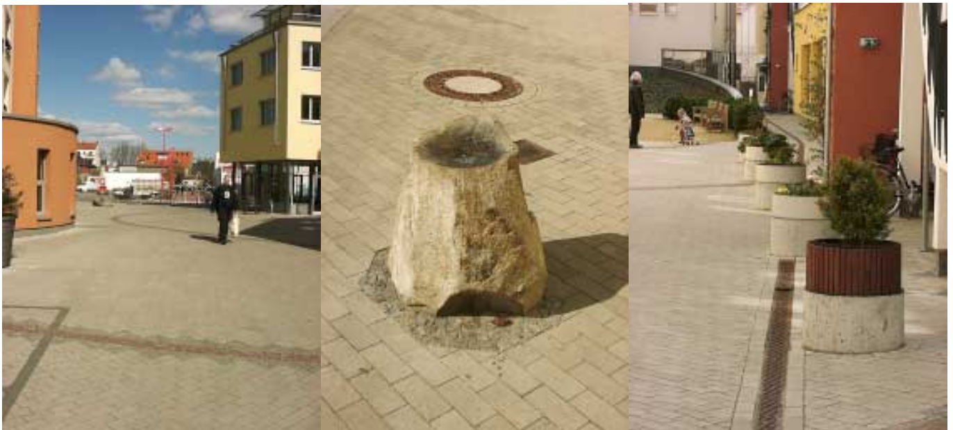
Abb.: Die gesetzliche Pflicht der Bauherr/innen, hausnahe Spielflächen zu bauen, ist im Beginenhof nicht erfüllt. Spiel- und Aufenthaltsmöglichkeiten sind nur in Ansätzen vorhanden.

Diese Verpflichtung ist beim Beginenhofprojekt nicht erfüllt. Der einzige vorhandene Spielplatz steht seit Juni 2003 als Außengelände des Kinderhauses Kodakistan nicht mehr der Allgemeinheit zum Spielen zur Verfügung.