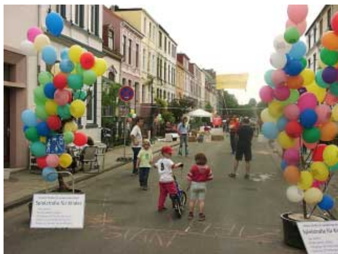
Abb. : Das Einfahrtstor zum „verkehrsberuhigten Bereich light“

Veranstaltet wurde die StraßenUmbauAktion von der Aktionsgemeinschaft Straßenspiel und der Elterninitiative Gellertstraße, mit Unterstützung von BUND (Bund für Umwelt- und Naturschutz Deutschland) Bremen und ADFC (Allgemeiner Deutscher Fahrradclub) Bremen.