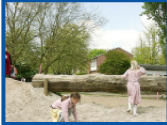
Kreative Ideen in Zeiten knapper Kassen