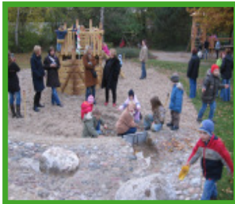
Die Kinder erobern mit Begeisterung ihr neues Spielschiff im KTH Saarburger Straße