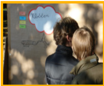
Jakobsberg: Phantasievolle Spielgeräte werden entwickelt und aufgemalt