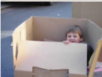
Eindrücke von der StraßenSpielAktion