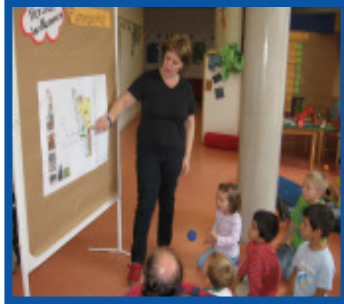
Kinderhaus Kodakistan: Die Architektin erläutert den Kindern ihre Planung

Bereits im März hatten sich die Schüler/innen der Schule Borchshöhe in Bremen-Nord in einer Zukunftswerkstatt Gedanken zur Umgestaltung ihres Schulhofes gemacht. Hauptthema für die Jungs waren Fußballspiel und ein Lavaberg und für die Mädchen eine Rutsche vom Berg, Wasser und ein Fossil. Zusätzlich interessant an dieser Schule sind die altersgemischten Klassen, die zur Zeit von der 1. bis zur 10. Klasse ausgebaut werden.