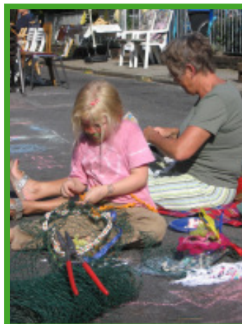
Eindrücke von der diesjährigen StraßenSpielAktion