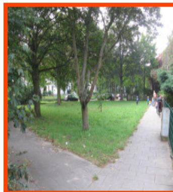
'Straßenbegleitgrün' in der Bennigsenstraße - bisher vor allem Hundewiese, hoffentlich bald Spielwiese

Die Ideen zur Umgestaltung wurden von den Kindern in einer Zukunftswerkstatt selber entwickelt. Gefördert wurde das Projekt vor allem von der Stiftung Wohnliche Stadt. Auch von der Gemeinschaftsaktion „SpielRäume schaffen“ gab es Fördergelder.