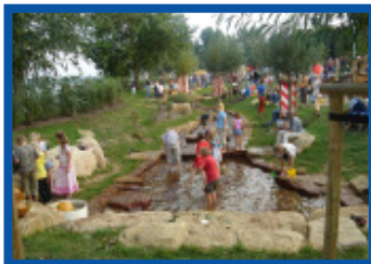
Der neue Wasserspielbereich

Auf zweierlei Weise wird nun versucht, Abhilfe zu schaffen: Zum einen wurden die Steine der Uferböschung befestigt, so dass sie nicht mehr herausgelöst werden können. Zum anderen lud das Kulturhaus Pusdorf zu einem Informationsabend mit dem Polizeirevier ein, auf dem dargestellt wurde, wie die Nutzer und Anwohner auf