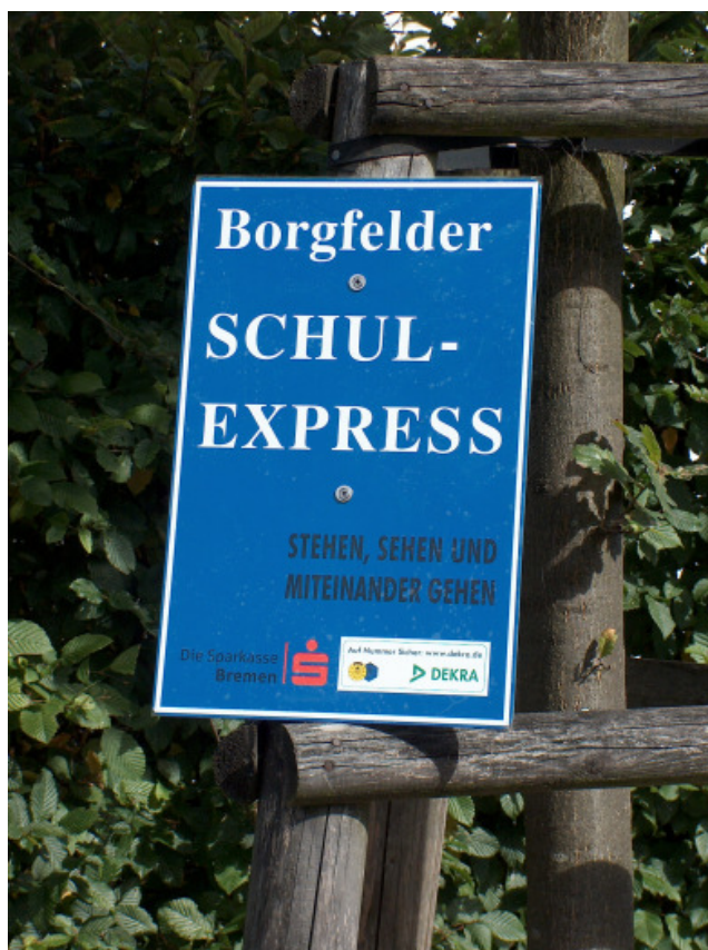
„Haltestelle“ des Borgfelder SCHULEXPRESS

Am 22. September 2004 ist der Borgfelder SCHULEXPRESS im Bremer Stadtteil Borgfeld eingeführt worden. Inzwischen dienen 18 Haltestellen im Umkreis von einem Kilometer zu den Borgfelder Grundschulen den Schulkindern als Treffpunkte, um gemeinsam zur Schule zu gehen.