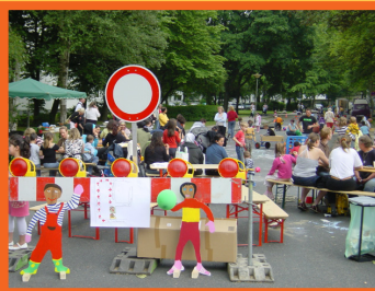
Platz zum beisammen sitzen und spielen

Klingende Materialien gibt es viele in der Natur. Steine und Holz finden wir fast