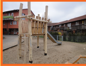
Der neue Spielplatz im Waller Dorf