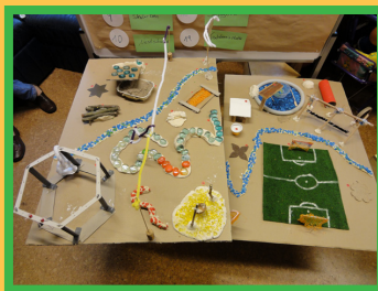
Modelle aus der Zukunftswerkstatt von Kindern

Am Sonntag war es zu spüren, daß es vor allem die Menschen sind, die aus einem ‚Unort‘ einen Ort der Begegnung machen können, trotz Bahnlärm und grauer Betonwände.