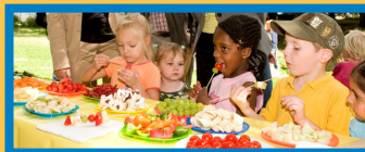
Gerne essen Kinder Obst und Gemüse