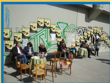
Ein Ergebnis der Planungsparty: hier soll eine bunte, geschwungene Bank hin