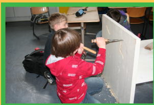
Mit Eifer und Einsatz ging es an die erste Bank