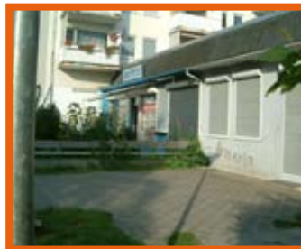
Der triste Vorplatz wird demnächst zum attraktiven Treffpunkt umgestaltet