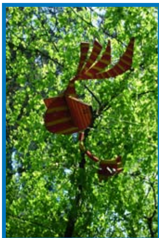
In einem Kunstprojekt an der Grundschule am Mönchshof entstanden

Beitrag: 30 Euro (inkl. Materialkosten); Anmeldung: bitte bis zum 30. April 2009 bei