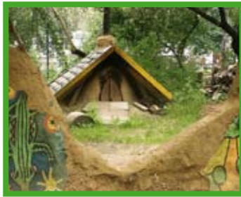
Lehmofen auf einem Spielplatz in Berlin