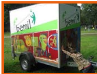
Selber schieben ist nicht nötig, gegen einen Aufpreis bringen wir bemil auch gerne bei Ihnen vorbei

Dank den Projektmitteln konnten 2008 neun Einrichtungen in Bremen und umzu ihren eigenen bemil erwerben. Wir freuen uns sehr, dass wir auch in diesem Jahr wieder zehn bemil - Sets zu besonders günstigen Preisen anbieten können. bemil gibt es in drei unterschiedlichen Setgrößen. Die umfangreichen Möglichkeiten des bemils lernt ihre Einrichtung innerhalb einer Fortbildung kennen. Nähere Informationen gibt es hierzu unter bemil auf unserer homepage.