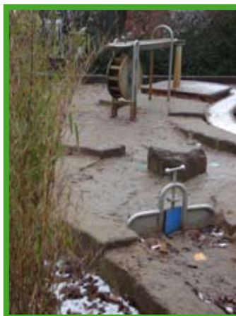
Der neue Wasserspielbereich in der Kita Engelkestraße