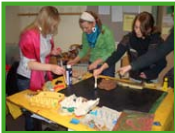
Die Jugendlichen bauen Modelle ihres zukünftigen Innenhofes

Die Ergebnisse werden nun zusammengefasst, der Schulöffentlichkeit präsentiert und an Stadtgrün zur Planung übergeben. Auch bei den folgenden Planungsschritten werden die Schüler wieder gefragt sein, damit das, was entsteht von den SchülerInnen mit Freude angenommen wird.