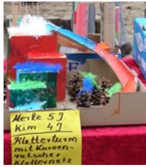
Von der Idee

lingslied der Kinder wurde ein rotes Band durchschnitten und die Kinder ließen bunte Luftballons steigen. Danach wurde der Turm von den begeisterten Kindern in ‚Beschlag‘ genommen.