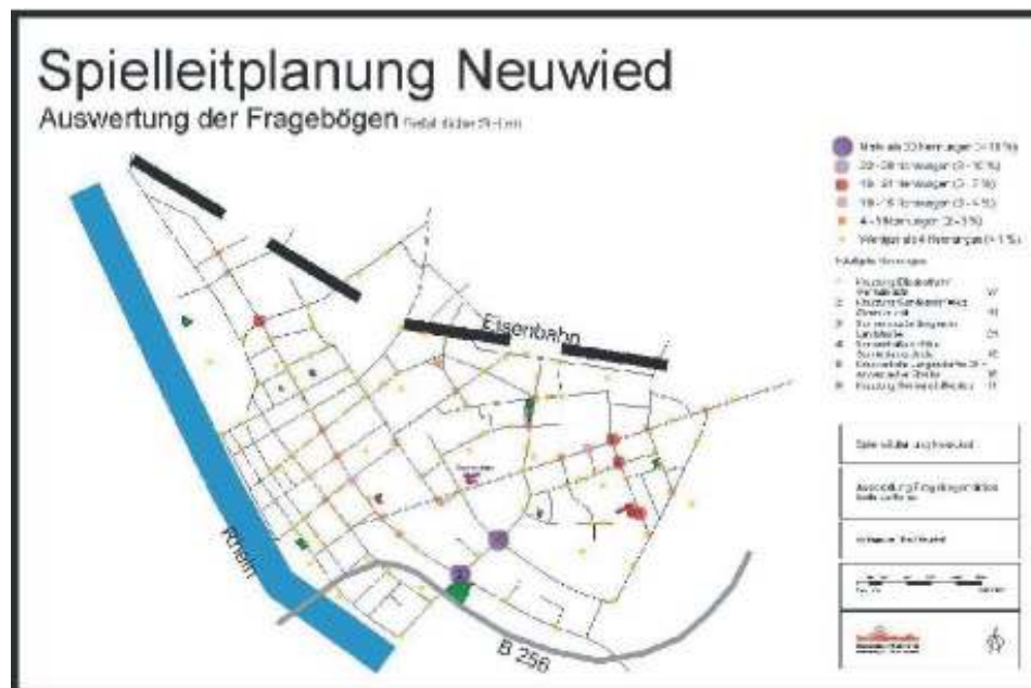
Frage 4 Gefährliche Stellen Art der Gefährdung