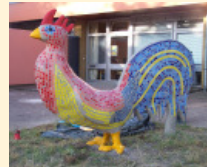
Der Hahn in Huchting Kindergarten Robinsbalje, Robinsbalje 14