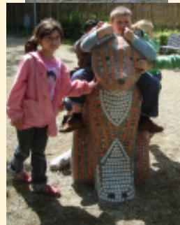
Die Katze in Lüssum Hort der Gemeinde Lüssum, Lüssumer Heide 8