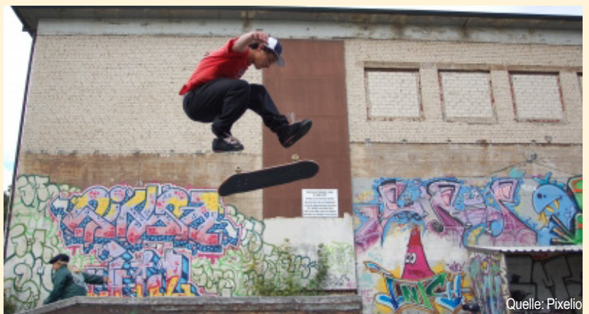
Die Stadt als Bühne sportliches Können zu entwickeln und darzustellen

Nach dem Konzept der ökologischen Zonen des Psychologen Urie Bronfenbrenner (1981) findet die Entwicklung im Kontext zwischen Mensch und Umwelt statt. Je reichhaltiger die Anregungen der sozialen Umwelt sind, desto stärker unterstützen sie eine differenzierte Persönlichkeitsentwicklung (vgl. Hurrelmann, S. 56). Im Idealfall erschließt sich der Jugendliche sein soziales und ökologisches Umfeld in konzentrischen Kreisen. Vom