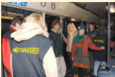
Die Nachtwanderer im Einsatz

Die Nachtwanderer sind eine freiwillige und ehrenamtliche Initiative von Eltern und anderen Erwachsenen, die Freitags und Samstags nachts von 22.00 bis 3.00 Uhr auf zentralen Plätzen und in Bussen und Bahnen präsent sind und Jugendlichen zur Seite stehen. Seit 2004 sind die Nachtwanderer in Bremen-Nord unterwegs. Mittlerweile gibt es Nachtwanderer auch in Huchting und Ritterhude. Derzeit beteiligen sich ca. 40 Personen bei den Nachtwanderern in Bremen-Nord. Jeder Nachtwanderer hat eine Schulung mit Deeskalationstraining und Erster Hilfe hinter sich. Auf den Wanderungen gibt es einheitliche Westen und eine Ausstattung mit Erste-Hilfe-Set, Handy und Taschenlampe.