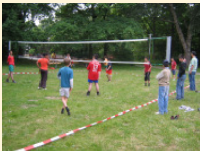
Der neue Volleyballplatz beim Jugendfreizeitheim Gröpelingen wird gut angenommen

Das Jugendfreizeitheim Gröpelingen hat ein umfangreiches Sportangebot, das überwiegend von Jungen angenommen wird. Sportbegeisterte Mädchen können sich gegen deren Dominanz selten behaupten und für reine Mädchenangebote gibt es leider nicht genug Interessentinnen. Auf einem Planungstag äußerten nun die anwesenden Mädchen ihren Wunsch nach einem Volleyballplatz. Als geeigneten Platz wählten sie eine öffentliche Rasenfläche zwischen dem Jugendfreizeitheim und dem Spielplatz Bromberger Straße. Mit Unterstützung durch den Förderfonds „SpielRäume schaffen“ und Eigenmitteln konnte das Projekt im Mai 2008 umgesetzt werden. Die Mädchen haben bei den nötigen Vorarbeiten mit angepackt, haben Müll gesammelt und Maulwurfshügel beseitigt.