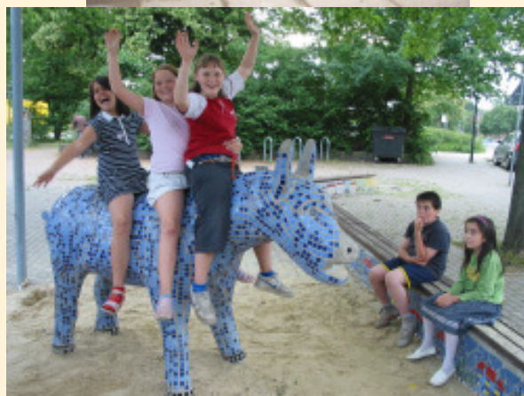
Der Esel in Oslebshausen Bürgerhaus Oslebshausen, Am Nonnenberg 40