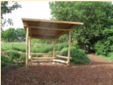
Vom Müllplatz zum Treffpunkt