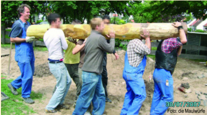
Solche Balken kann man nur gemeinsam bewältigen