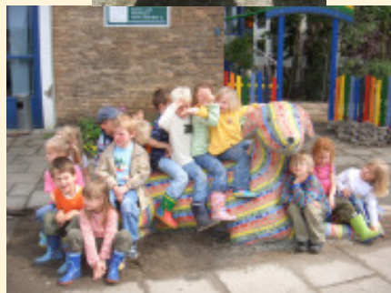
Der Hund in Sebaldsbrück Kindergarten der evangelischen Versöhnungsgemeinde Sebaldsbrück, Sebaldsbrücker Heerstraße 52