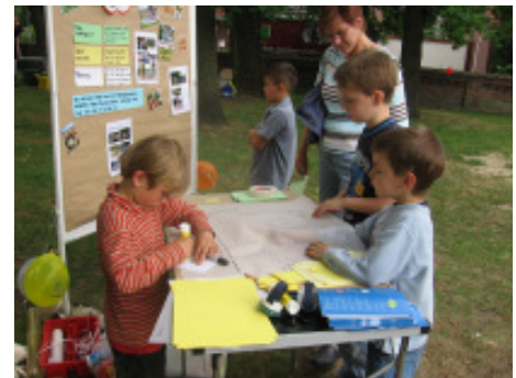
...auf dem Plan verortet...

Nach dem allgemeinen Ideensammeln gab es am Infotisch einen Plan im Maßstab 1: 100, auf dem die Bäume, die Mauer und die bestehenden Wege eingezeichnet waren. Zuerst wurde kurz erklärt, wie man einen Plan liest (Vogelperspektive). Die meisten Kinder können sich schon mit 6-7 Jahren auf solch einem Plan zurechtfinden. Nun konnte jeder seine Ideen auf den Plan bringen. Dazu gab es vorbereitete kleine Kärtchen mit Spielgeräten als Zeichnung. Wenn die eigene Idee nicht dabei war, konnte man sich neue Kärtchen zuschneiden und die Idee daraufmalen. Diese Kärtchen konnten nun auf dem Plan hin und hergeschoben werden. Wenn man mit der Planung zufrieden war und alle Ideen untergebracht hatte gab es noch einen verkleinerten Plan auf DinA 4. Hier wurde die Ideenskizze übertragen und dann konnte der nächste Planer / die nächste Planerin ans Werk gehen.