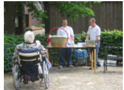
Für Getränke und Würstchen ist gesorgt