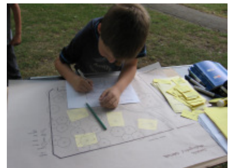
...und schließlich auf einen eigenen Zettel übertragen

Die elf, so entstandenen Planvorschläge sind im Anhang zu finden.