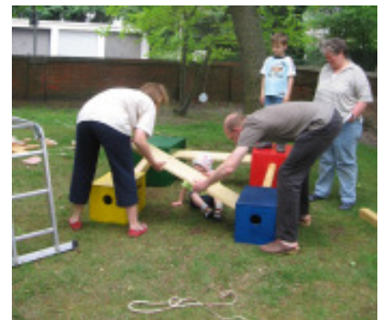
Bei der Bewegungsbaustelle werden auch die Erwachsenen aktiv