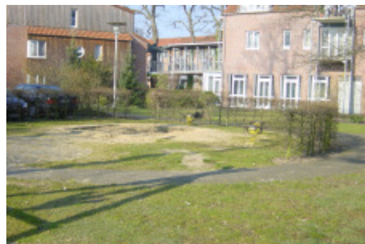
Der Spielplatz beim Stiftungsdorf Osterholz