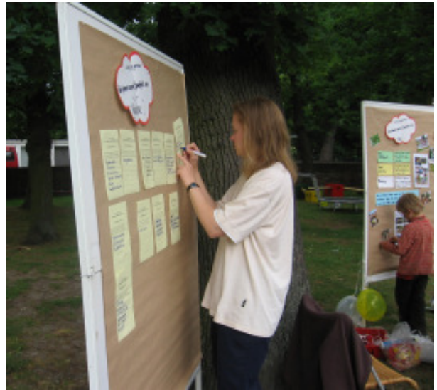
Ideen werden gesammelt...

Neue Schaukel Trampolin Neuer Sand Neue Schaukelpferde Tunnelrutsche Seilbahn Bespielbare Skulpturen Basketball Baumhaus Rutschbahn aus Metall Minigolf Tischtennisplatte großes Holzschiff