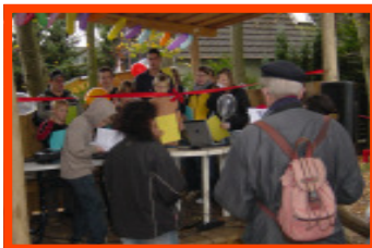
Stolz betrachten die Kinder und Jugendliche die Dokumentation ihres Projektes