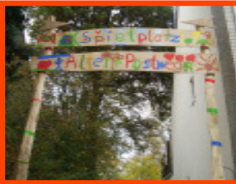
Kinder gestalten ihr Eingangstor zum Spielplatz