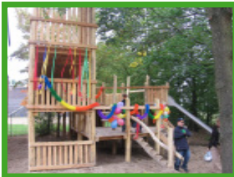
Der Grundschulhof am Bunnsackerweg wird eingeweiht

Bereits im April hatten die Lehrer/innen der Grundschule an der Freiligrathstraße sich einen Nachmittag mit dem Aufbau eines Schülerparlamentes an ihrer Schule intensiv beschäftigt. Nachdem zwei engagierte Kolleginnen sich dieses Themas angenommen hatten, konnte im September das Schüler/innen-Parlament mit Vertreter/innen aus allen 2. bis 4. Klassen erstmals zusammentreten. Als Hauptthemen brachten die Delegierten