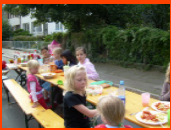
Die Kinder der Gabriel-Seidl-Straße haben mächtig Spaß!