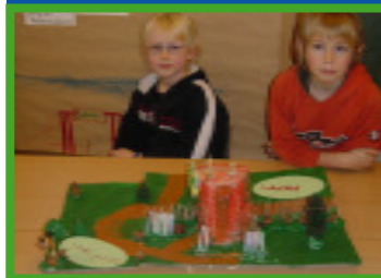
Die Kinder präsentieren stolz ihre Ergebnisse

Ansprechpartner: Erika Brodbeck Tel: 0421 / 242 895 55 Sabine Schweitzer (BUND) Tel.: 79002-40