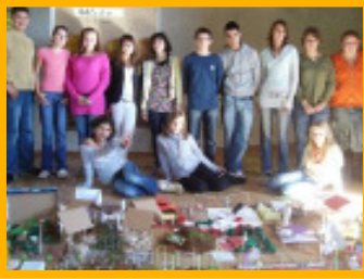
Die Schüler der Albert-Einstein-Schule präsentieren ihre Modelle