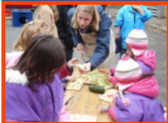
Kinder der KITA Heinrich-Imbusch-Straße beim Spielen und Kochen