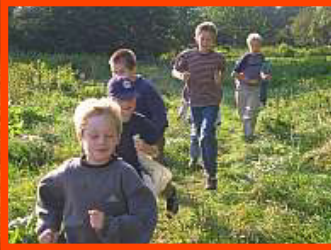
Unterwegs in der Kinderwildnis