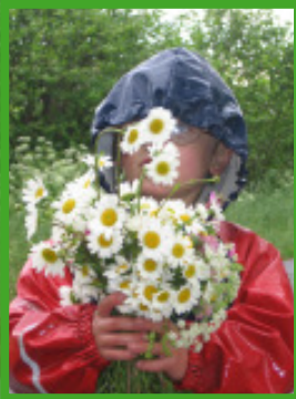
Die Natur hält viel bereit zum Spielen