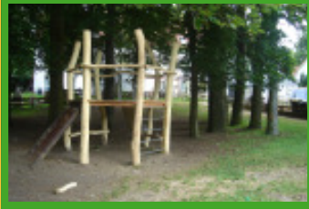
Der neue Kletterturm in der Vegesacker Heerstraße

Knapp ein Jahr nach den allerersten Ideen kann die Spielrauminitiative erste Erfolge feiern. In Zeiten knapper Kassen war es ein mühsamer Prozess, die nötigen Gelder zu beantragen. Aber dank dem Ideenreichtum der Initiative gelang es, neben Fördergeldern auch einige Sachspenden zu erhalten. Sogar Spielgeräte bekam die Initiative gespendet, dank dem wachen Auge der Initiativberatung im Amt für Soziale Dienste. Die Kinder sind begeistert über die neuen Angebote und sind nun viel mehr draußen als bisher. Auch unter den Eltern entstehen neue Kontakte, da man sich jetzt draußen trifft.