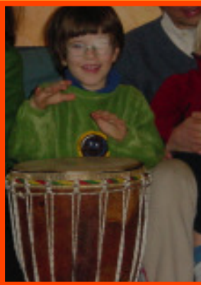
Trommeln macht stark

Samstag, den 11. November, 9.00 - 16.00 Uhr Ort: SpielLandschaftStadt e.V., Horner Heerstraße 19