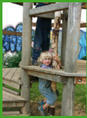
Wie breit ist ein 'Norm'-Kind?

Anmeldung bitte bis zum 30. Oktober Beitrag: 42 Euro