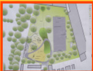
Der Planentwurf für den Spielplatz Alter Postweg

Der öffentliche Spielplatz im Alten Postweg in Hastedt liegt etwas versteckt in einem Hinterhofbereich. Nachdem vor wenigen Jahren das Fußballfeld mit Ballfangzaun erneuert worden war, stehen nun Gelder zur Verfügung, auch für Kinder und Kleinkinder das Angebot zu erneuern. Im September 2005 hatten Kinder des Stadtteils und Erwachsene ihre Vorstellungen und Wünsche in einer Zukunftswerkstatt formuliert, ein erster Plan war im Oktober 2005 diskutiert worden. Die aktuelle Planung wurde beim Planungszirkel am 17. Mai mit Anwohner/innen, Kindern und Jugend-