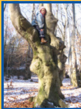
Der Baum als Spielplatz