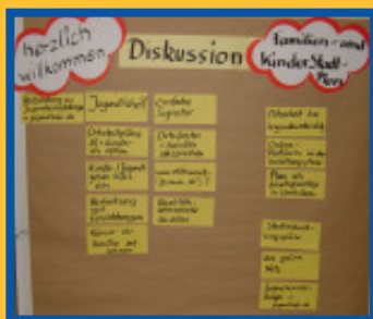
Ergebnisse eines Workshops zum Kinderstadtplan

Homepage www.bremer-familienstadtplan.de