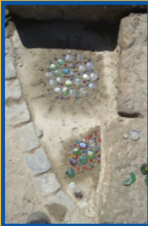
Mosaiksonnen zieren den neuen Wasserbereich auf dem Spielplatz am Centaurenbrunnen

Der öffentliche Spielplatz am Leibnizplatz wurde in die gegenüberliegenden Neustadtwallanlagen verlegt. Am Freitag, den 13. Mai 2005 wurden in einem Planungsworkshop am Centaurenbrunnen mit Kindern und Erwachsenen Ideen entwickelt und Planungsansätze diskutiert. Nach einer längeren Planungs-, Abstimmungs- und Bauphase konnte der neue Spielplatz nun am 23. Juni von Umweltsenator Ronald-Mike Neumeyer eingeweiht werden. Als Einweihungsaktion wurden neben Luftballons, die in den Neustädter Himmel stiegen, mit Kindern der Hortgruppe der Zionsgemeinde Mosaiken in Zement gelegt, um den Sand- und Wasserspielbereich zu verschönern. Kurz darauf wurden weitere Mosaiken von einer zweiten Klasse der Grundschule Kantstraße gelegt. Aus Glassteinen und Kieselsteinen sind sehr schöne Ornamente entstanden. So wurden z.B. eine Pepperoni und mehrere Sonnen dargestellt.