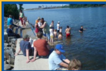
Die neue Treppe wird eingeweiht

Ein besonderer Schwerpunkt des Projekts ist die intensive Bewohnerbeteiligung. Die ersten Erfahrungen hierzu wurden in einem thematischen Newsletter ausgewertet, den Sie von der Projekt-Homepage www.b-sure-interreg.net herunterladen können.